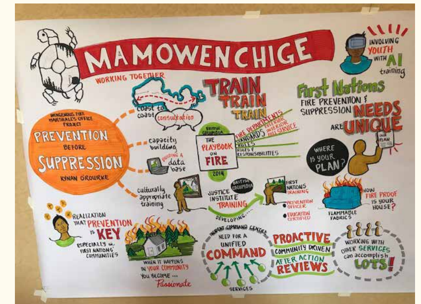
Une interprétation artistique de la présentation du BCAI à la conférence « Mamowenchige – Working Together » du conseil tribal Nookiwin à Thunder Bay, Ontario, le 22 octobre 2019.